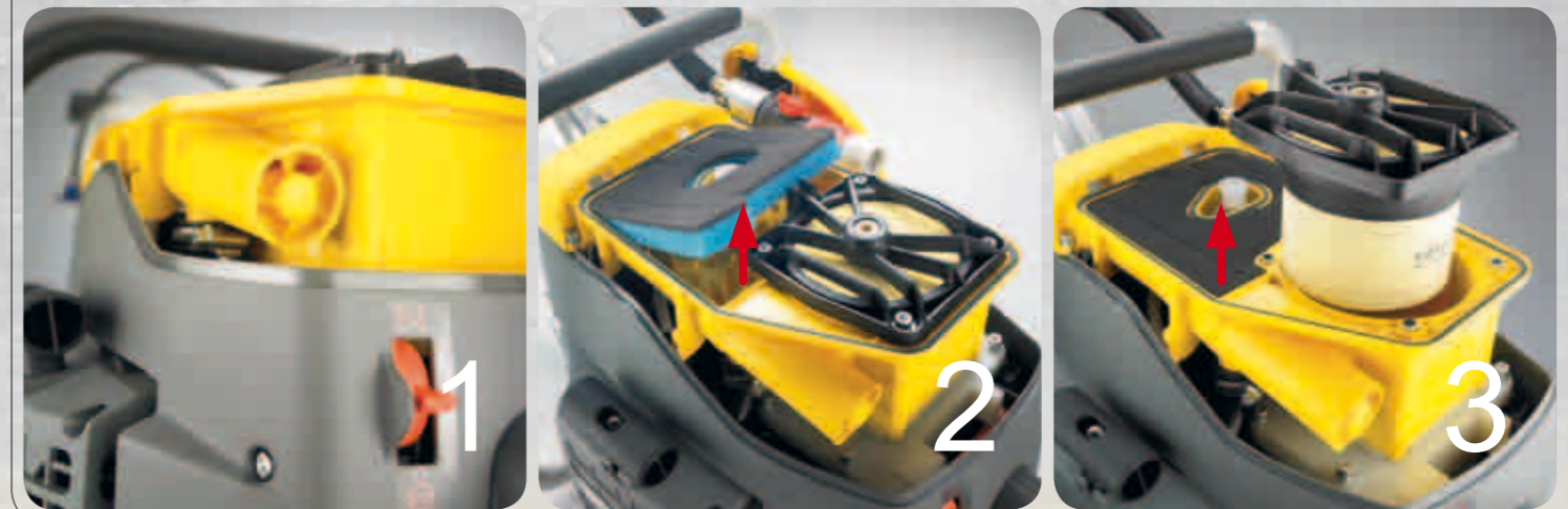
1 Ciklon szűrő

A 3-réteges légszűrő-rendszer: a beszívott levegő először a ciklon-leválasztón halad keresztül, a szennyezőrészecskék legnagyobb részétől már ott megszabadulva. Ezután következik a műanyag szivacs szűrő. Az előtisztított levegő csak a végén kerül a főszűrőre. Ez a szűrési módszer a sokszorosára növeli a légszűrő élettartamát . Ráadásul csak csekély nyomásvesztés alakul ki, ami egyenletesen nagy motorteljesítményt eredményez.