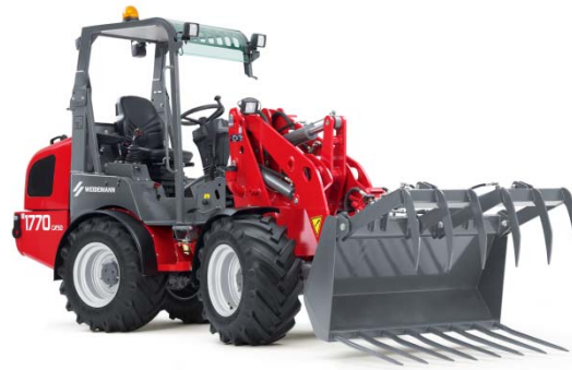
Radlader 1770 CX50