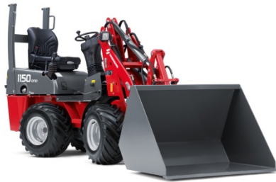
Hoftrac® 1150 CX30